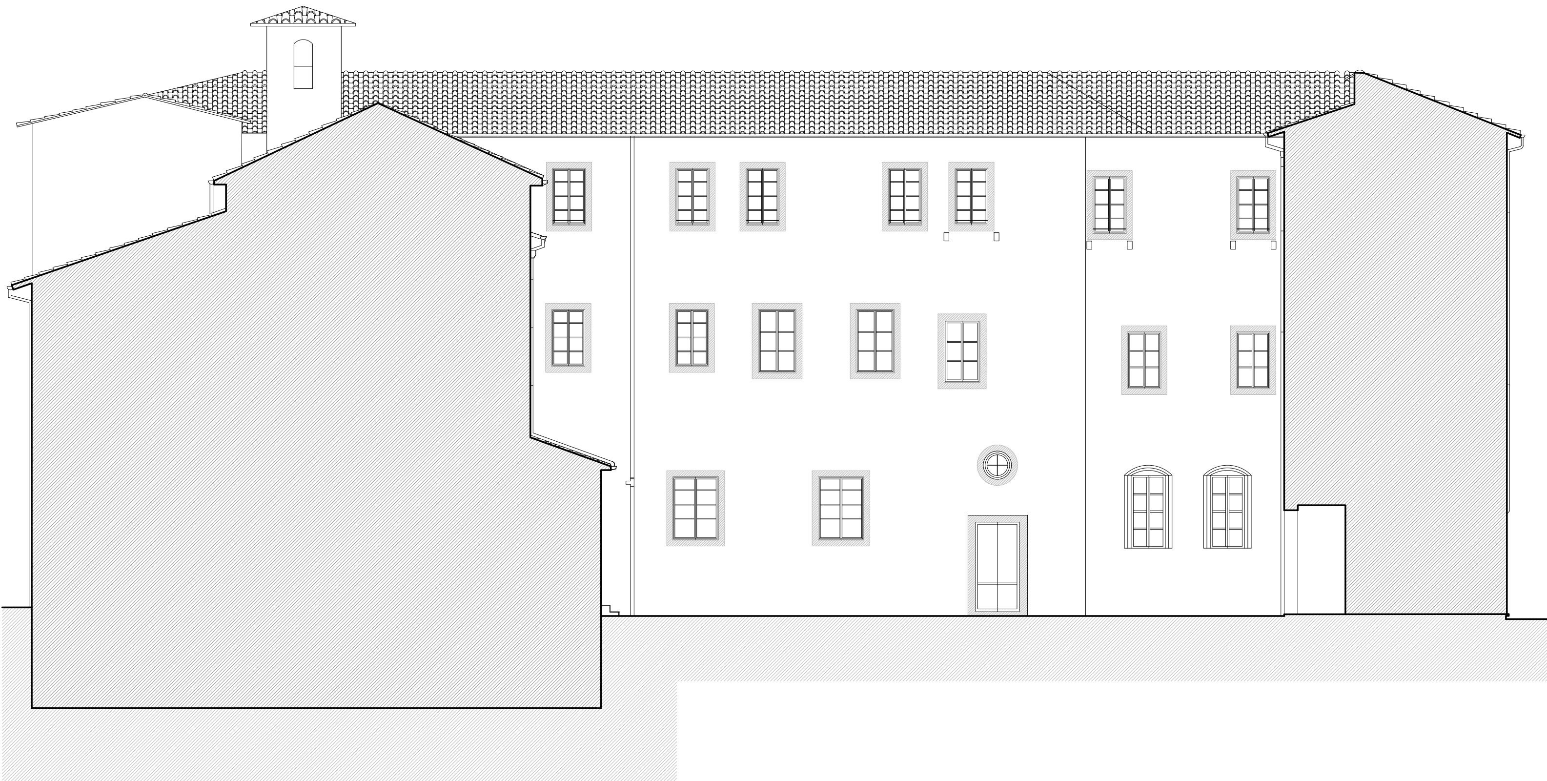
3 - PROSPETTO CORTILE D'ACCESSO