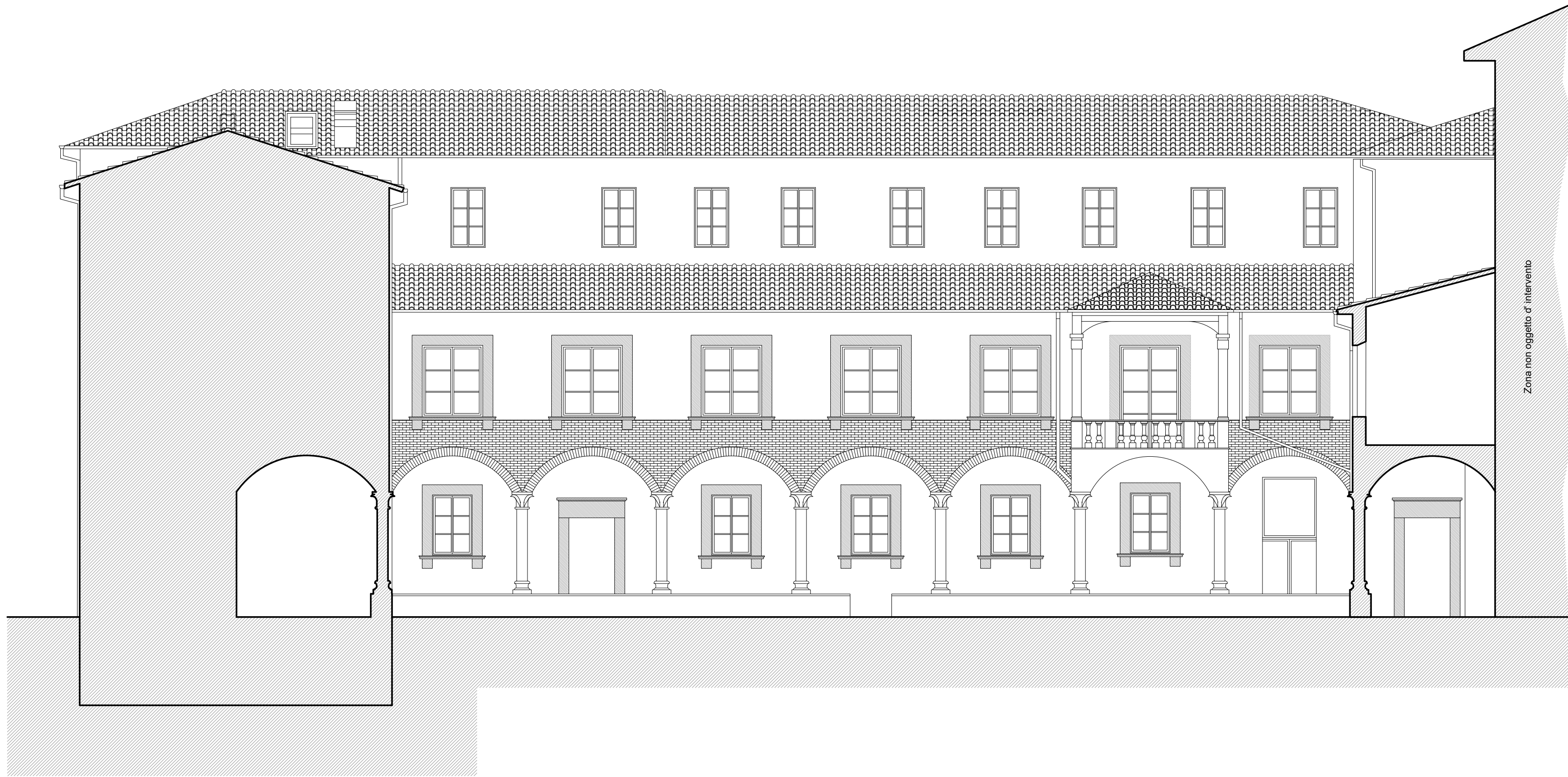
2 - PROSPETTO CHIOSTRO INTERNO