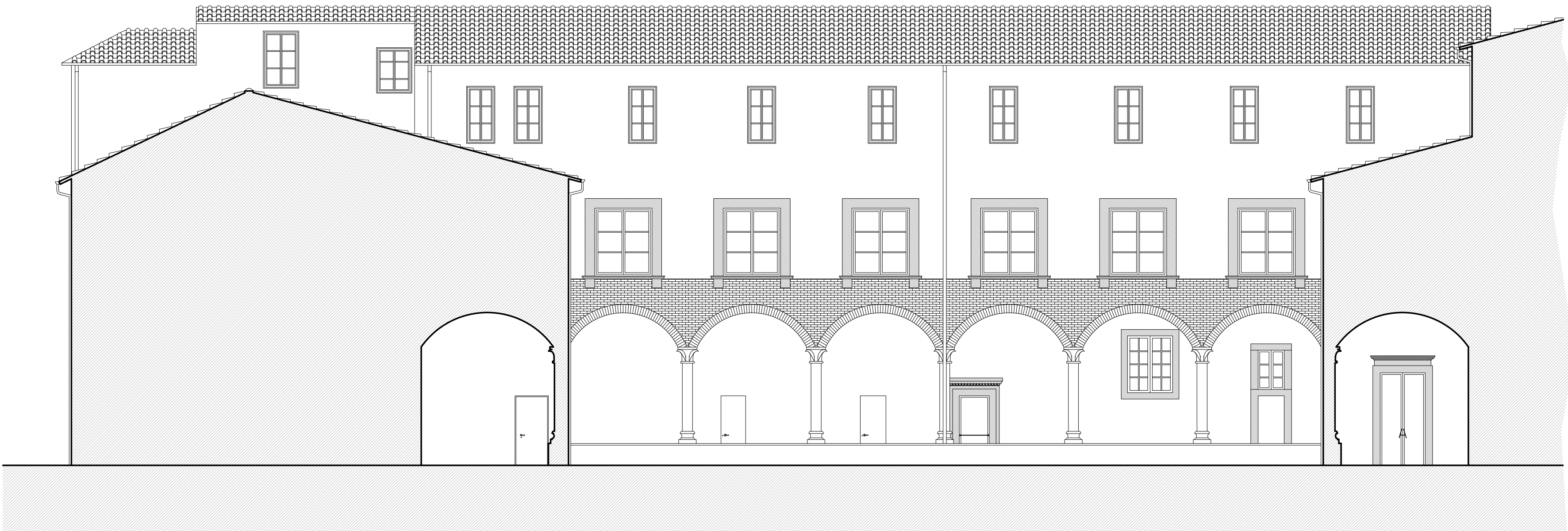
4 - PROSPETTO CHIOSTRO INTERNO