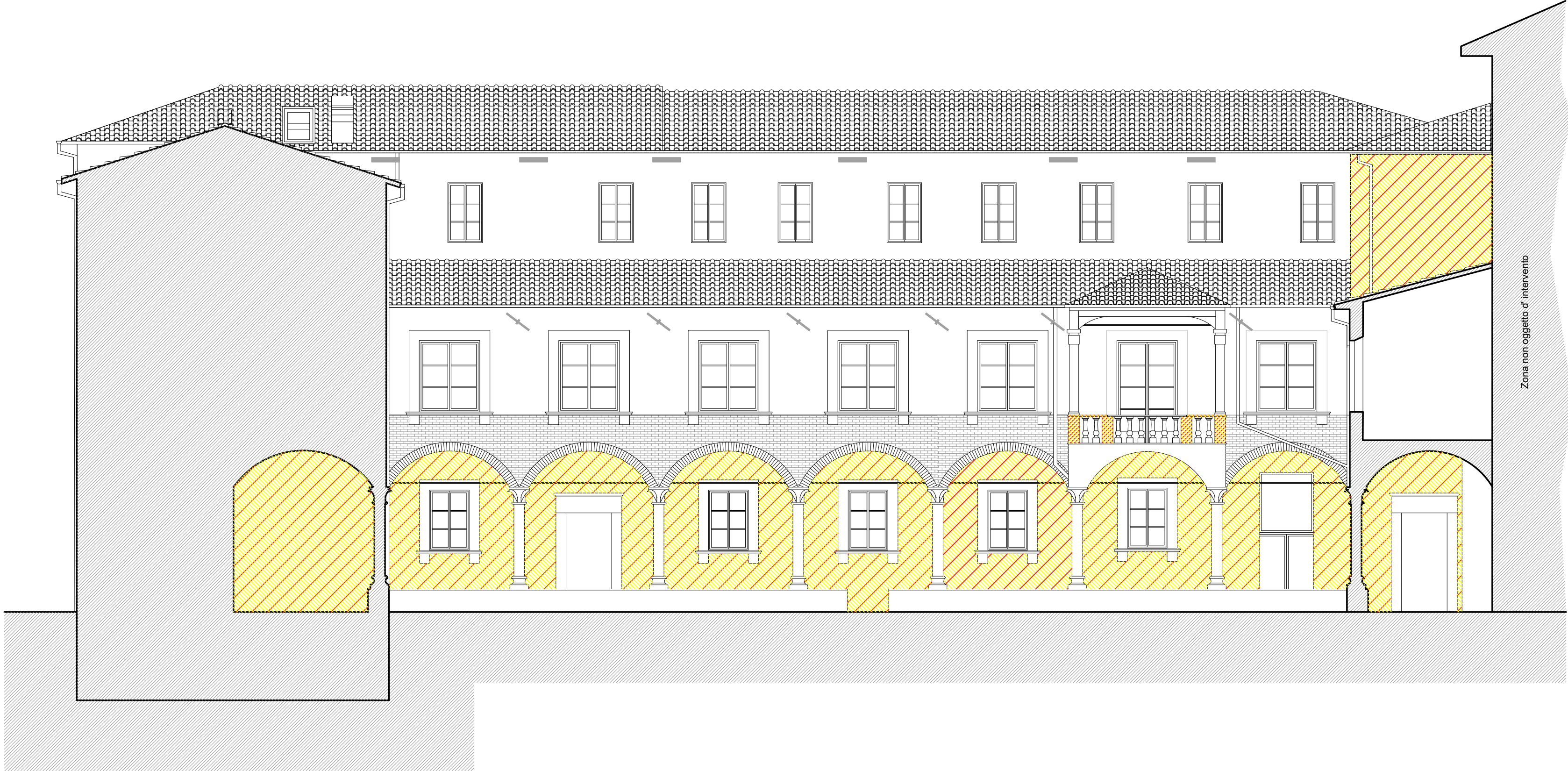
2 - PROSPETTO CHIOSTRO INTERNO